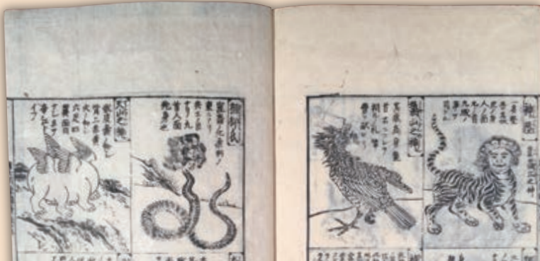
[写真] 右上:「近世期絵入百科事典データベース」画面 左下:『唐土訓蒙図彙』(日文研海野文庫蔵)